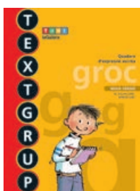
TEXTGRUP groc nivell de progressió (TERCER)