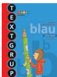
TEXTGRUP blau nivell bàsic (SEGON)