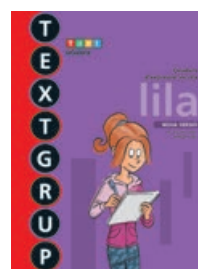
TEXTGRUP lila nivell molt avançat (SISÈ)