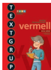
TEXTGRUP vermell nivell avançat (CINQUÈ)